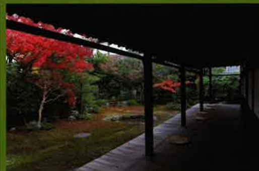
巴の庭(本阿弥光悦作)の紅葉